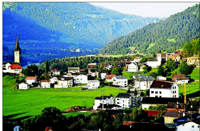
Sagogn beneventa ils 15 e 16 d'october il teater popular svizzer.