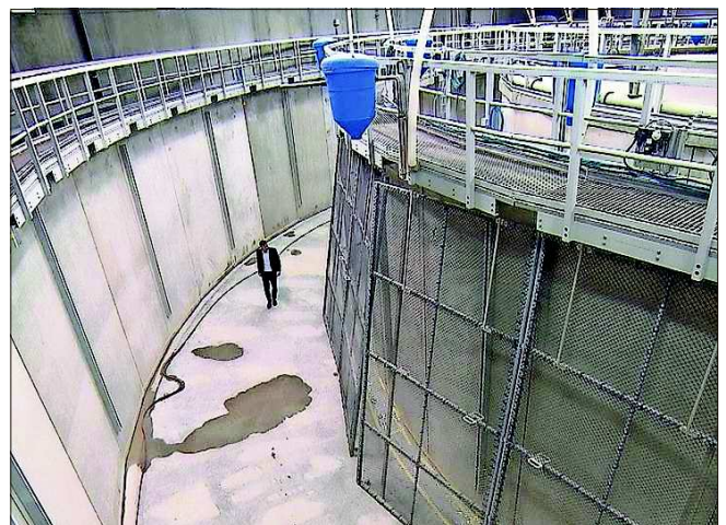
En curt temp sa nodan en quella bagnola a Lostalto tschients da scaruns.

■ La mar sa svida plaunet e la tratga da peschs daventa adina pli attractiva. A Lostalto è actualmain la pli gronda tratga da scaruns en construcziun. Il scarun turna en il Grischun, ma na dal Rain siador. A Lostalto en il Mesauc è la Swiss Alpin Fish SA vidlonder dad ereger ina tratga da peschs. Ella duai daventar ina da las pli grondas en Svizra e la suletta che producescha scarun. Ina sort pesch che vegn enfin uss cumplainmain importada en Svizra. Per gronda part da tratgas fabricadas en la mar. La tratga da peschs daventa ordvart attractiva pervia dal consum creschent da pesch e visavi a la pesca excessiva en la mar che lai sminuir las resursas natiralas. La Swiss Alpin Fish SA garegia ina produczion durabla da ses scarun. E gist quella durabladad tschenta l'organisaziun fair-fish che sa fatschenta cun la tratga da peschs en dumonda. Per ella èn diversas dumondas perturgant il nutriment dals peschs e la derivanza na scleridas uschia che la tratga da peschs na possia betg mitigiar la pesca excessiva sin la