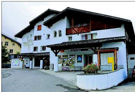
La stizun a Curaglia. Il mument porscha ella aunc products da Maxi.

Differentas opziuns ein gia vegnidas scclaridas, denter auter il retuorn dil Denner el vitg. Tenor la gruppa da lavur vegn ina tala buc en damonda sin fundament dalla sviulta. «Ils scclariments muossan: Sche nus lein haver vinavon ina stizun el vitg stuein nus prender quei fatg sez enta maun. Tgi che vegni la finala a furnir la stizun ei aunc aviert», communichescha la gruppa da lavur. Ina pusseviltad fussi da fundar in'associaziun sco menadra. Tenor la gruppa eis ei buca caussa dalla vischnaunca da menar ina stizun. «Ella sa denton scaffir bunas premissas da rama, per exempel contribuziuns da fundaziun ni favorevels tscheins d'affittaziun», scriva la gruppa da lavur.