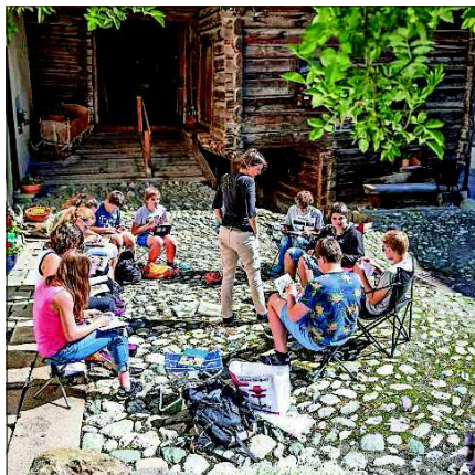
Igls scolars e las scolaras dalle classes superiouras Alvra e Surses s'occupos cuil tema Giovanni Segantini.